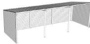
MBBXBA0903: Box 3x9m