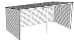
MBBXBA060: Box 3x6m