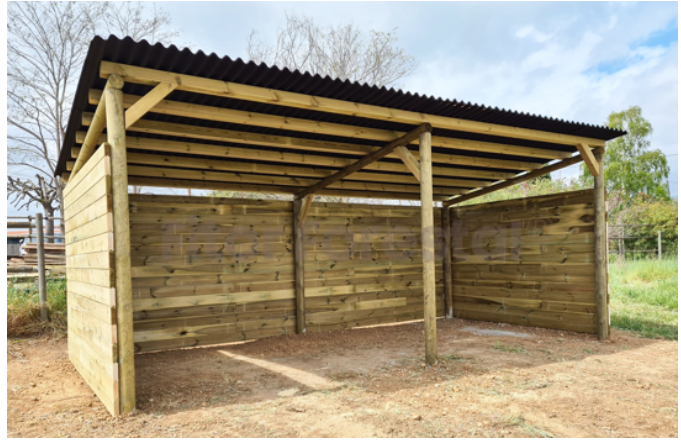
Gamma Box Basic

Frontals (tancaments fixes/portes) Divisors intermitjos (opcions a mida)